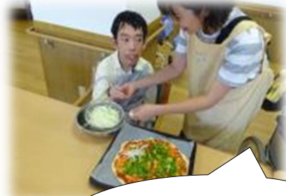
クッキングでピザを 作りました！