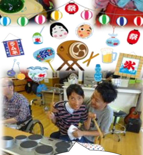
音楽プログラムで 太鼓をたたいたよ