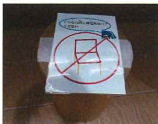
貼り紙で分かりやすく！