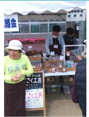
たくさんの方に買って頂きました

6月4日に開催された「北区民ふれあいまつり2017」に出店しました。開催場所が船岡山公園から清明高等学校グラウンドに移ってからは初めての参加となりました。当日は朝から多くのお客様が来られ、大変なにぎわいでした。「図書館の下のところのさくさく工房やね」「久しぶりに買うことができました」といったお客様の声を聞くことができました。また試食を食べて、「おいしいね、もう一つ買うわ」といったお客様もおられ、販売を担当した方はとても喜んでおられました。