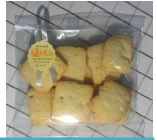
レモンの風味香るクッキーです

製菓班では、今年度も新しい商品の開発に取り組んでいます。今回は塩レモンを使用したクッキーです。塩レモンは手作りしてみました。愛媛県産のレモンに塩をまぶして漬けた塩レモンを生地に練り込み作りしました。 数量限定で販売中なので、どうぞご賞味ください。